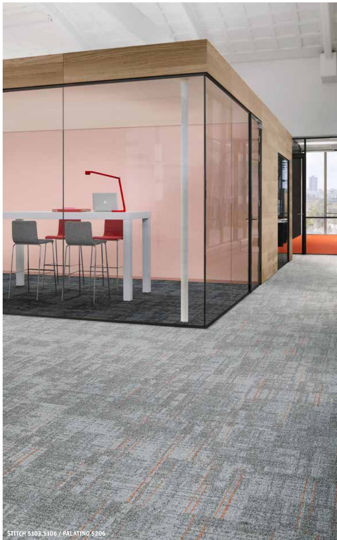
STITCH 5103,5106 / PALATINO 5206