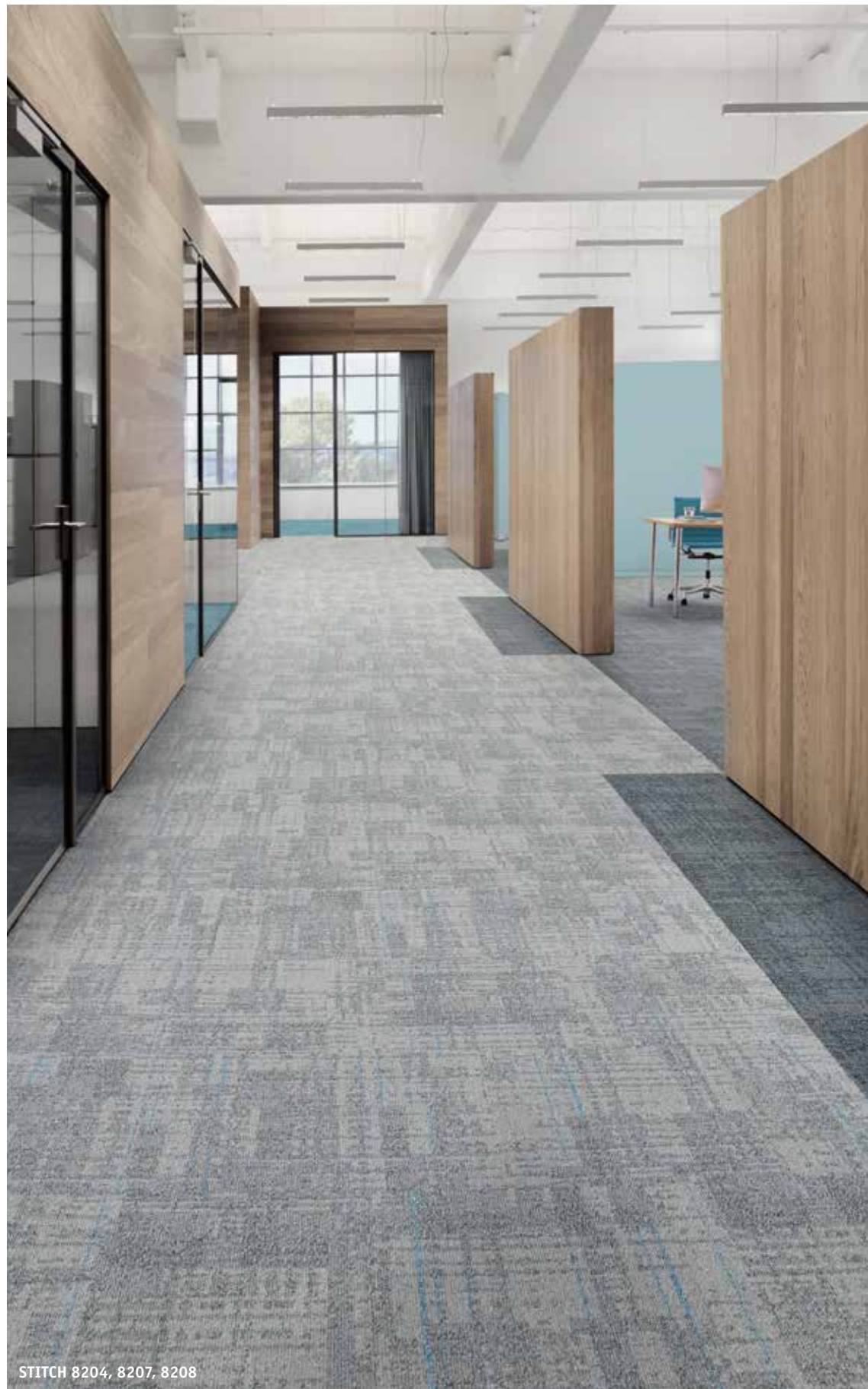
STITCH 8204, 8207, 8208