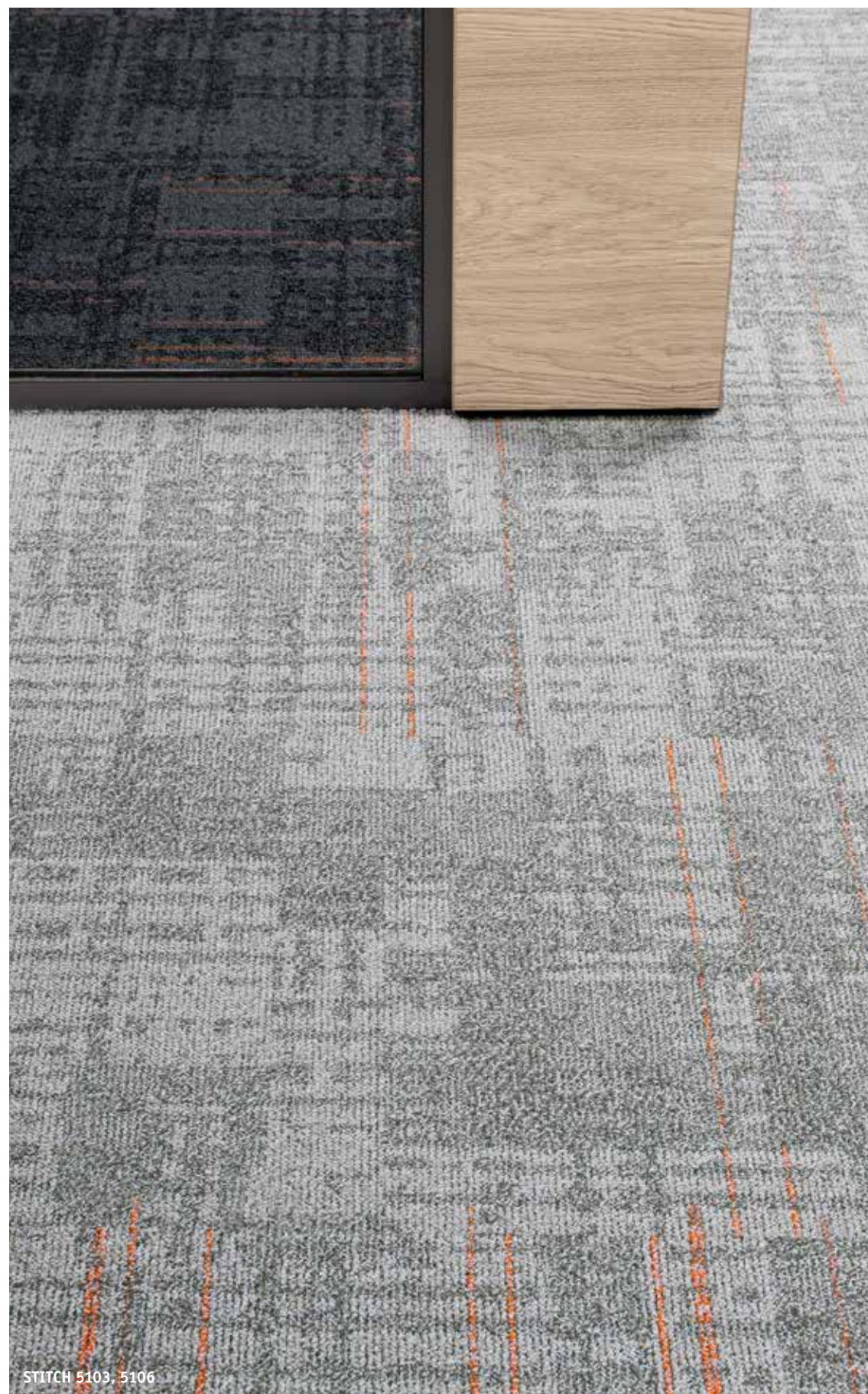
STITCH 5103, 5106