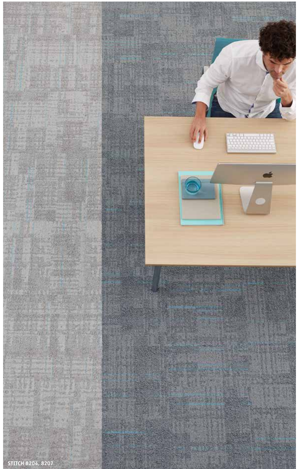
STITCH 8204, 8207