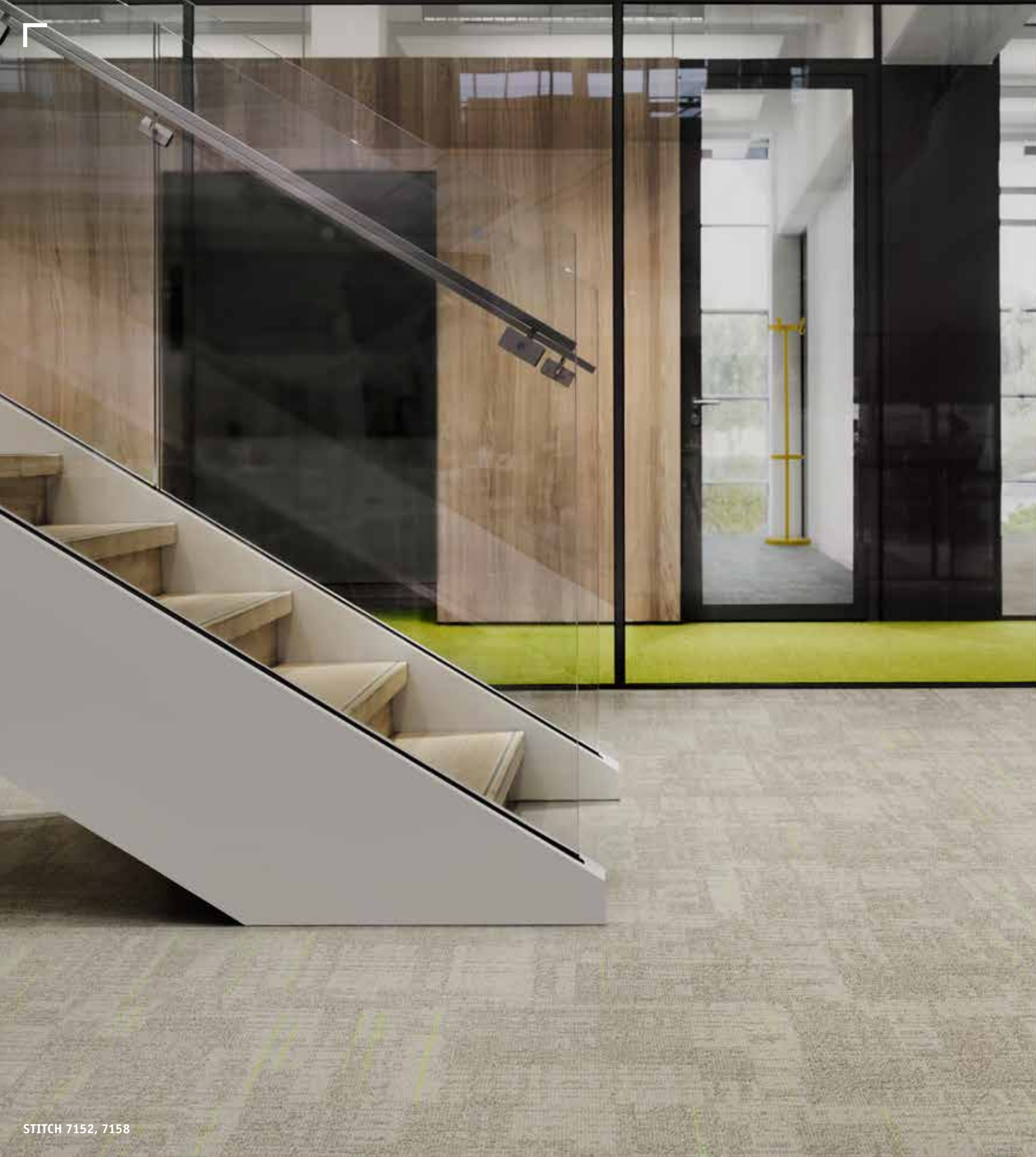
STITCH 7152, 7158